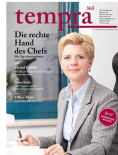
Das Management-Magazin des Bundesverbandes Sekretariat und Büromanagement e. V. (bSb) für Office Professionals